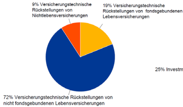
Abbildung 1: Versicherungstechnische Rückstellungen, Aufschlüsselung nach Rückstellungsart (in % der gesamten Rückstellungen; Ende Juni 2017)